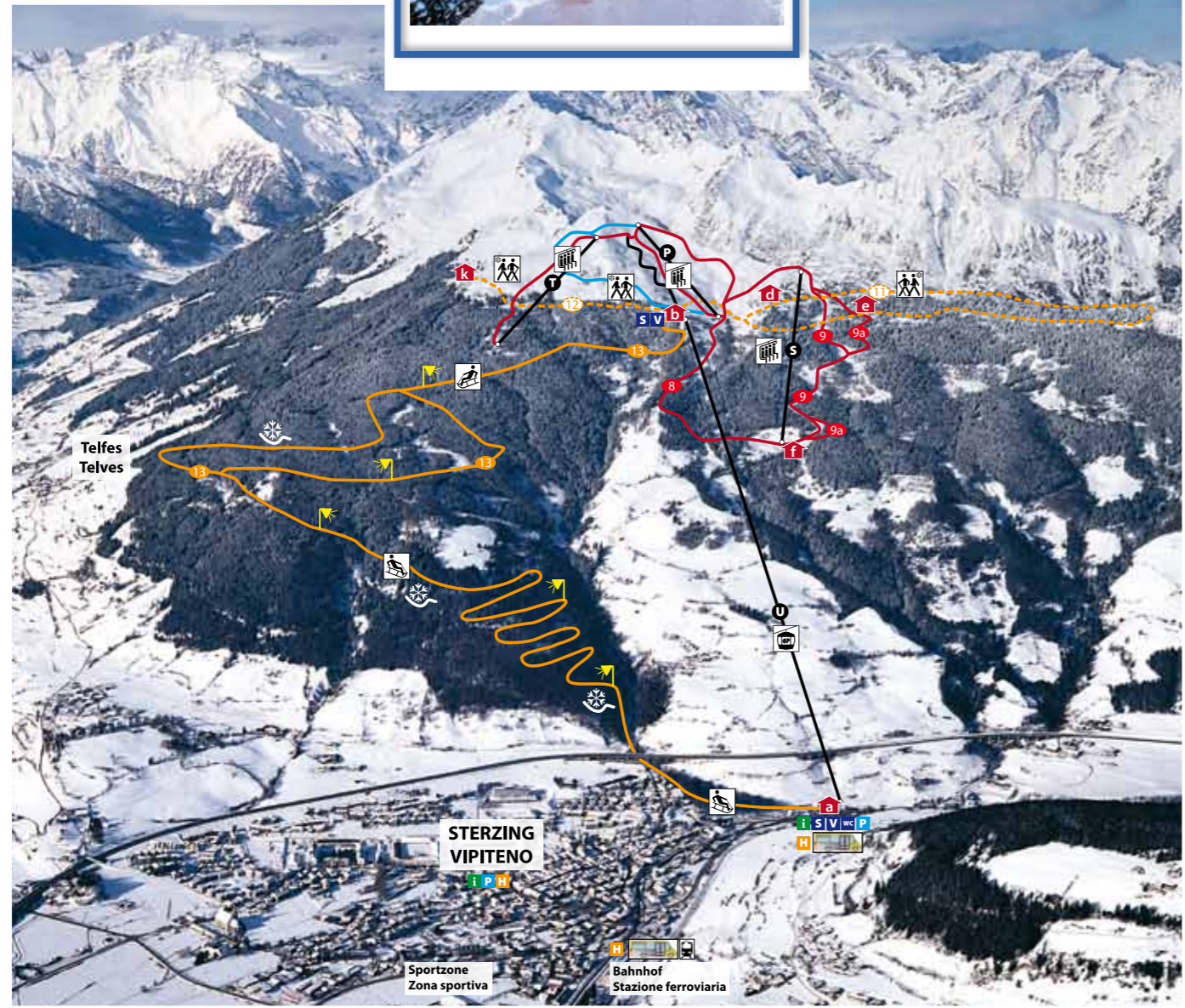
Foto: Tappeiner, Lana - Überflieger: graphic Kraus, Sterzing / Vipiteno

Gruppenpreise ab 20 Personen Riduzione prezzo per gruppi, min. 20 persone Preisänderungen vorbehalten / Prezzi salvo cambiamenti